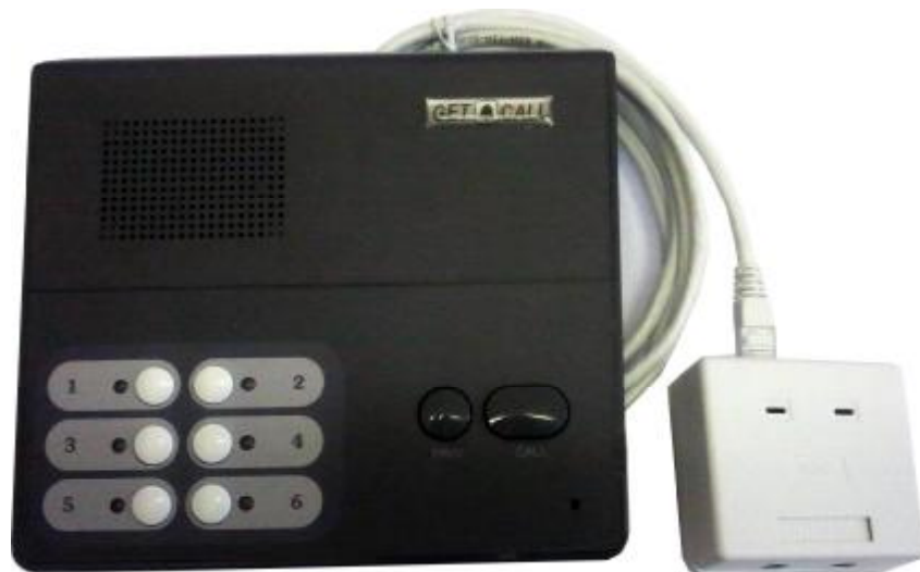
Рисунок 1-Внешний вид пульта ZAA23850Z3