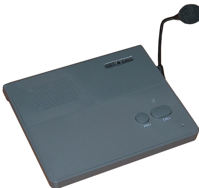
Рисунок 4.1. Внешний вид пульта GC-1001D3

Пульт (рис.4.1) имеет пластмассовый корпус темно-серого цвета. На верхней поверхности пульта находятся кнопки выбора режима работы с абонентским устройством «PRIV» и «CALL», встроенный динамик, микрофон и светодиодный индикатор включения пульта. Имеется микрофон на гибкой стойке длиной 17 см, устанавливаемый в разъем на правой боковой стороне пульта. Также на правой боковой стороне пульта расположены регуляторы громкости внутреннего динамика (обозначение на корпусе «динамик») и внешнего громкоговорителя (обозначение на корпусе «трубка»). На нижней поверхности пульта расположены регуляторы чувствительности микрофона и громкости звучания гонга.