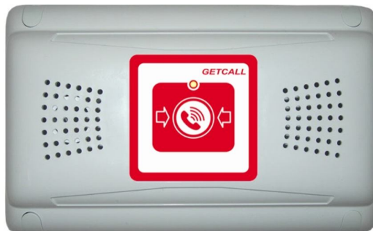
Рисунок 4.2. Внешний вид GC-2001W3

Устройство (рис.4.2) выполнено в пластиковом корпусе белого цвета и имеет настенную конструкцию с встроенным громкоговорителем и встроенным микрофоном. На лицевой панели имеется мембранная клавиша для вызова пульта.