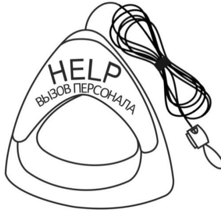
Рисунок 2. Дополнительная ручка со шнуром для кнопок вызова MP-060W1

При использовании кнопки вызова в душевой для МГН может понадобиться добавление к ней второго захвата (дополнительной ручки). Для этого используется дополнительная ручка красного цвета со шнуром красного цвета для кнопок вызова MP-060W1. Длина шнура - 1 м. Внешний вид дополнительной ручки со шнуром для кнопок вызова приведен на рис.2.